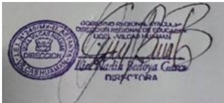
COORDINADOR DE INICIAL