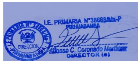
COORDINADOR DE PRIMARIA