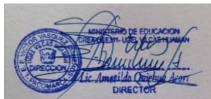
COORDINADOR DE SECUNDARIA